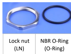
Lock nut (LN)